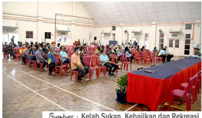
Sumber : Kelab Sukan, Kebajikan dan Rekreasi