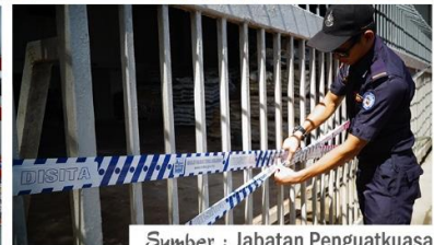
Sumber : Jabatan Penguatkuasa