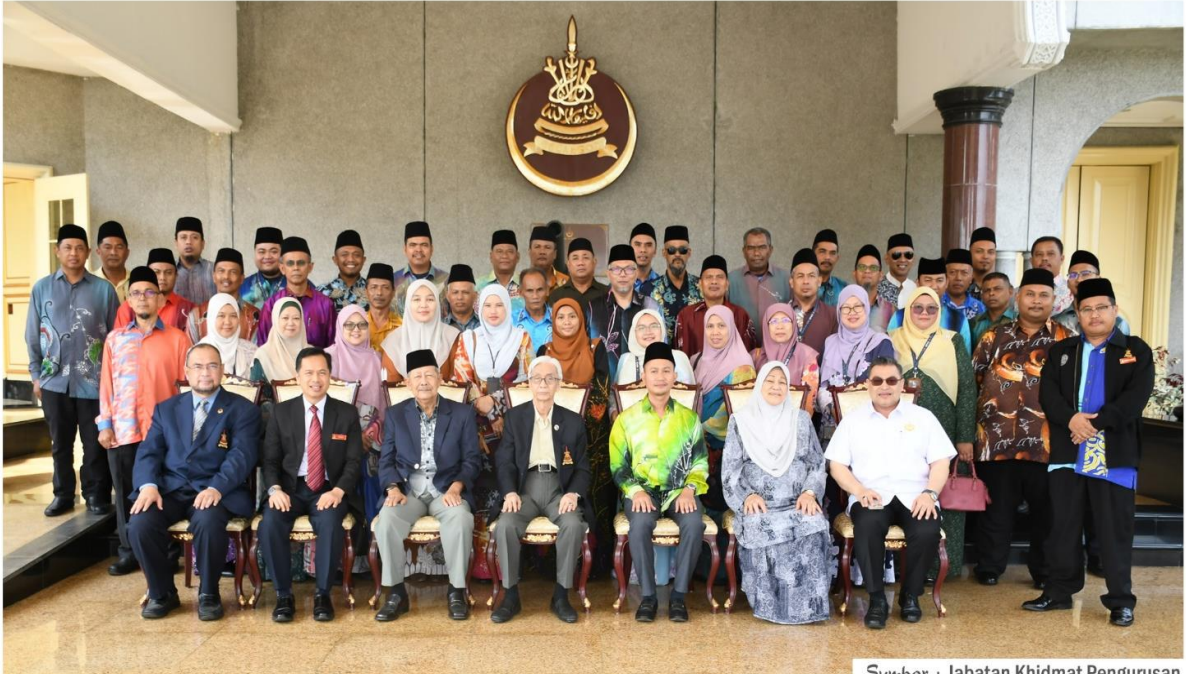
Sumber : Jabatan Khidmat Pengurusan

Lawatan bermula di Galeri Diraja Sultan Abdul Aziz dan diikuti Istana Alam Shah. Lawatan ilmiah ini bertujuan memberi pendedahan mengenai adat istiadat Istana Selangor kepada warga MPKS yang hadir ke lawatan ini. Terima kasih diucapkan kepada pihak pengurusan Istana Alam Shah kerana sudi menerima kunjungan Delegasi MPKS.