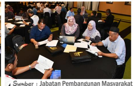
Sumber : Jabatan Pembangunan Masyarakat