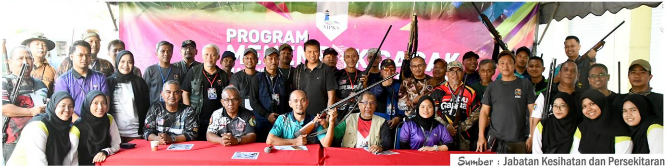
Sumber : Jabatan Kesihatan dan Persekitaran